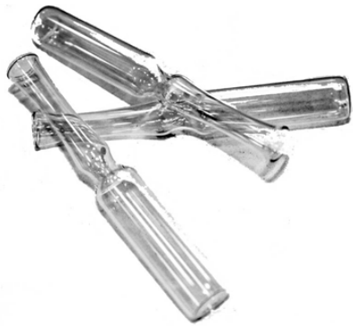
Рис. 2. Материал до дробления