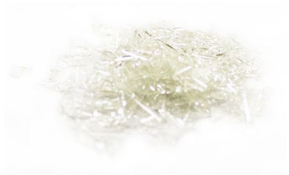
Рис. 3. Продукт дробления