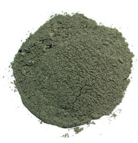
Рис. 4. Продукт измельчения