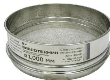
Рис. 3. Сито С20/50