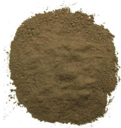
Рис. 5. Продукт измельчения