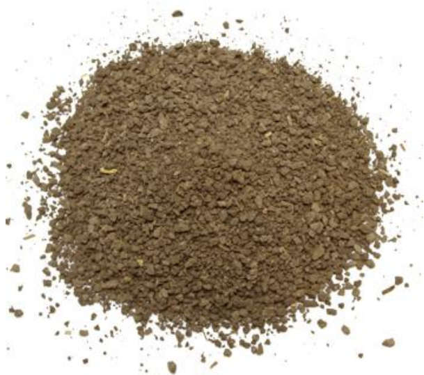
Рис. 4. Материал до измельчения