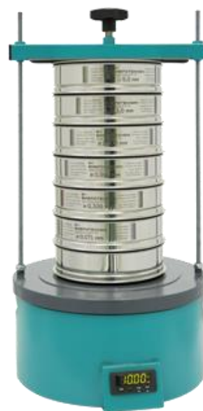
Рис. 2 Анализатор ситовой А 20