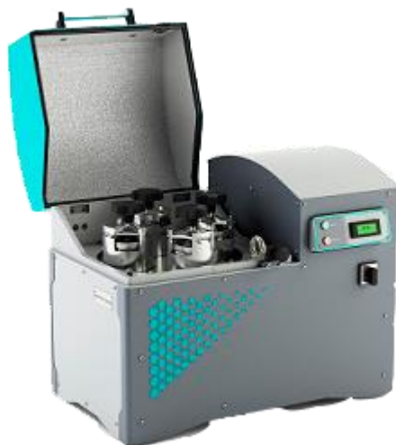
Рис. 1. Планетарная мельница МПП 1-4

1.3 Поставленная задача: Измельчение 90% материала до крупности менее 10 мкм, требуемая производительность – не менее 20 проб/час.