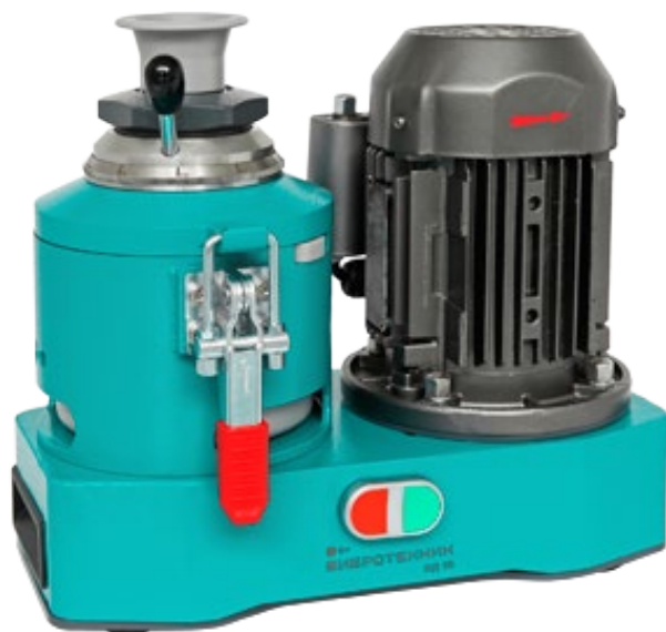
Рис. 1. Истиратель дисковый ИД 65