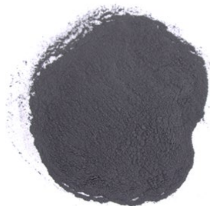
Рис. 4. Продукт измельчения