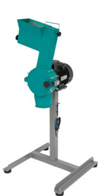
Рис. 1. Роторная ножевая мельница РМ 120