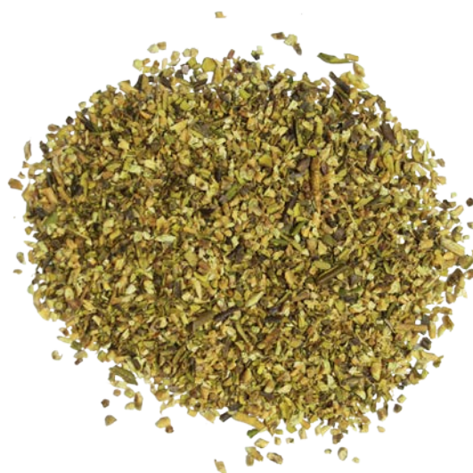
Рис. 3. Продукт измельчения