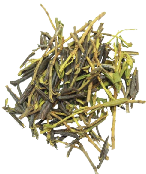
Рис. 2. Материал до измельчения