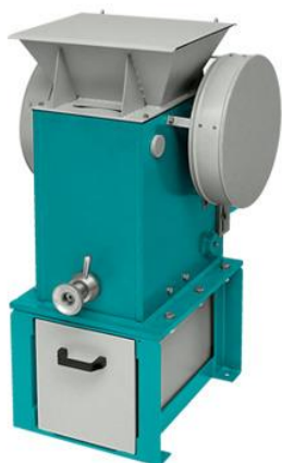
Рис 1. Щековая дробилка ЩД 10