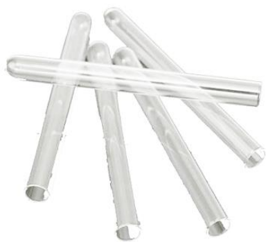
Рис.3. Материал до дробления