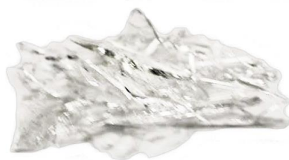
Рис.4. Продукт дробления