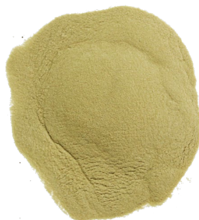
Рис. 3. Продукт измельчения