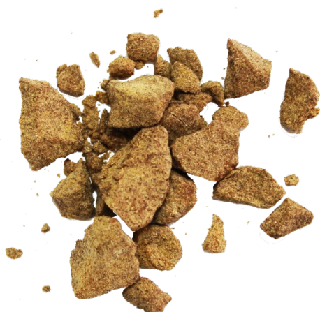
Рис. 2. Материал до измельчения