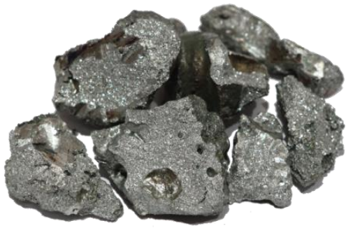
Рис. 3. Материал до дробления