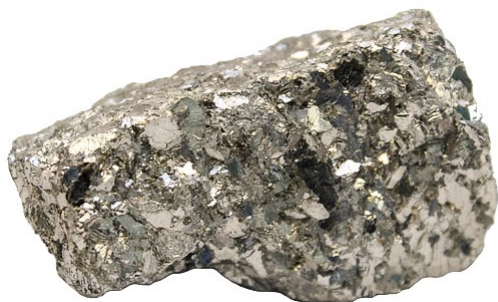
Рис. 3. Материал до дробления