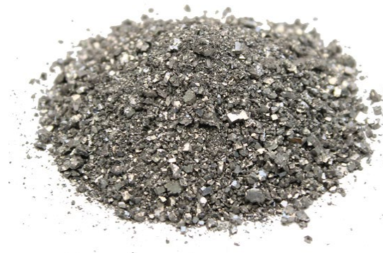
Рис. 4. Продукт дробления