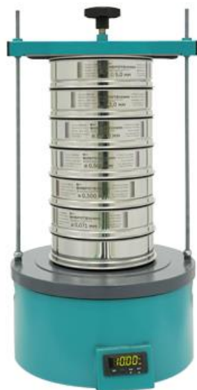
Рис. 1. Анализатор А 20