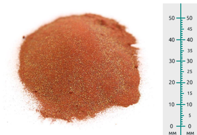
Рис. 2. Продукт отсева