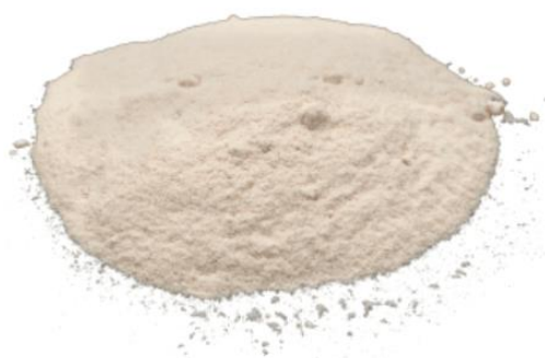
Рис. 4. Продукт измельчения.