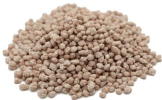
Рис. 3. Материал до измельчения.