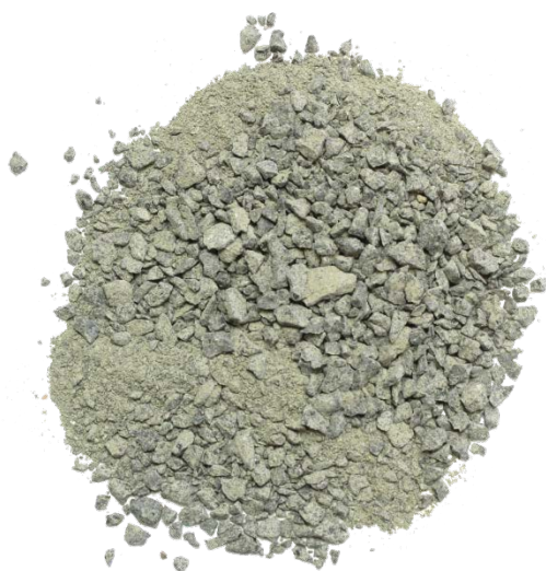
Рис. 3. Материал до измельчения