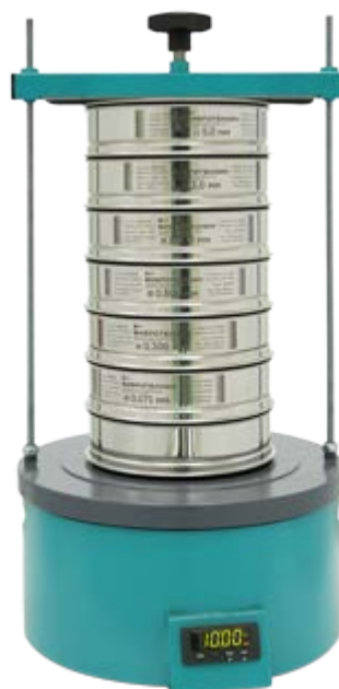
Рис. 2 Анализатор ситовой А 20