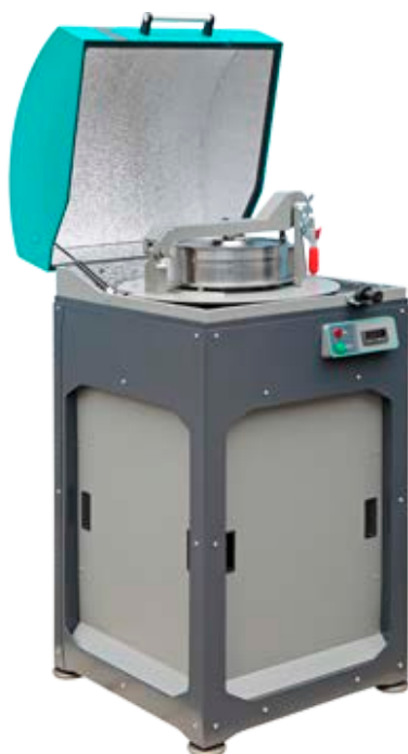
Рис. 1. Истиратель вибрационный ИВУ

1.3 Поставленная задача: Определение фракционного состава продукта измельчения при измельчении в течение 5 и 10 мин., сравнение результатов;