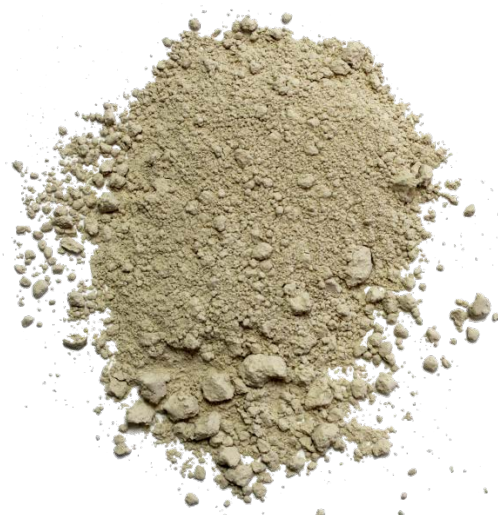
Рис. 4. Продукт измельчения