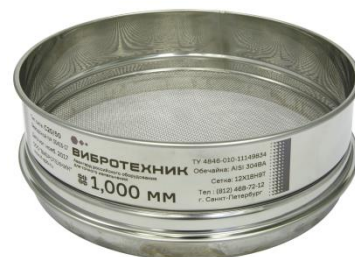
Рис. 3. Сито С20/50