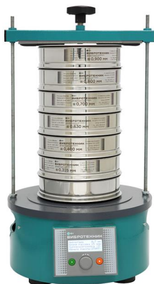
Рис. 2 Анализатор А 20 на базе Вибропривода ВПС