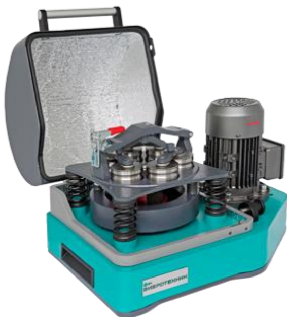
Рис. 1. Истиратель вибрационный ИВ 6