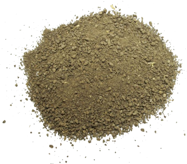
Рис. 4. Материал до измельчения