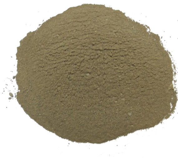
Рис. 5. Продукт измельчения