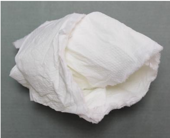
Рис. 2. Материал до измельчения