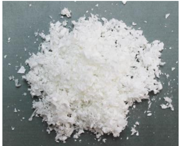
Рис. 3. Продукт измельчения