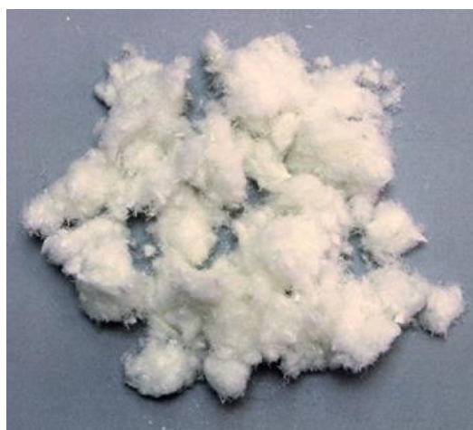
Рис. 3. Продукт измельчения