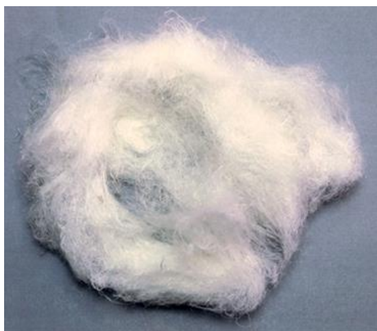
Рис. 2. Материал до измельчения

2.1.4 Результат: Из-за волокнистой структуры материала оценить гранулометрический состав продукта измельчения не представляется возможным. Размер продукта измельчения оценивался визуально и составил от 2 до 6 мм.